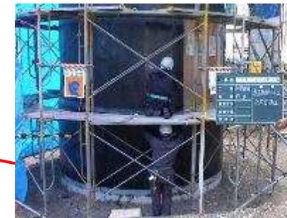
耐震;炭素繊維シート補強