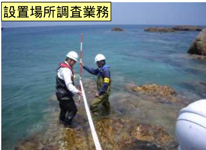
設置場所調査業務