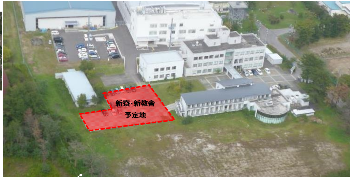
海上保安学校宮城分校