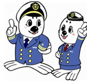
「うみまる」と「うーみん」