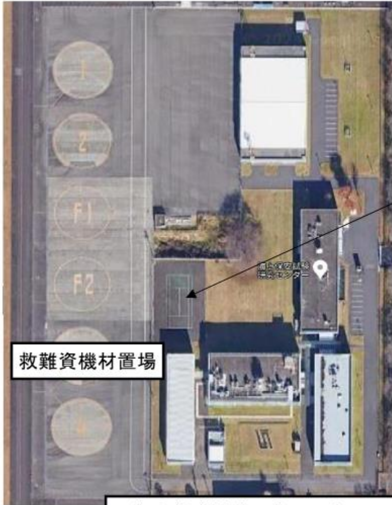
海上保安試験研究センター