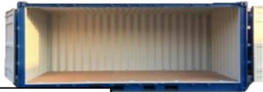
20フィート 特殊(長辺開き)コンテナ