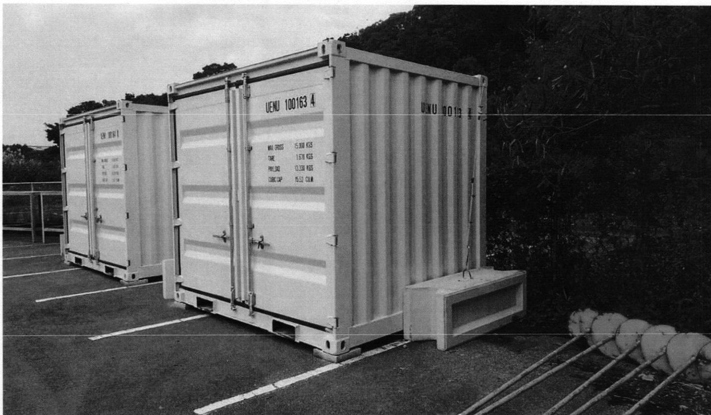
写真はトンブロック（12 フィート版）の使用例