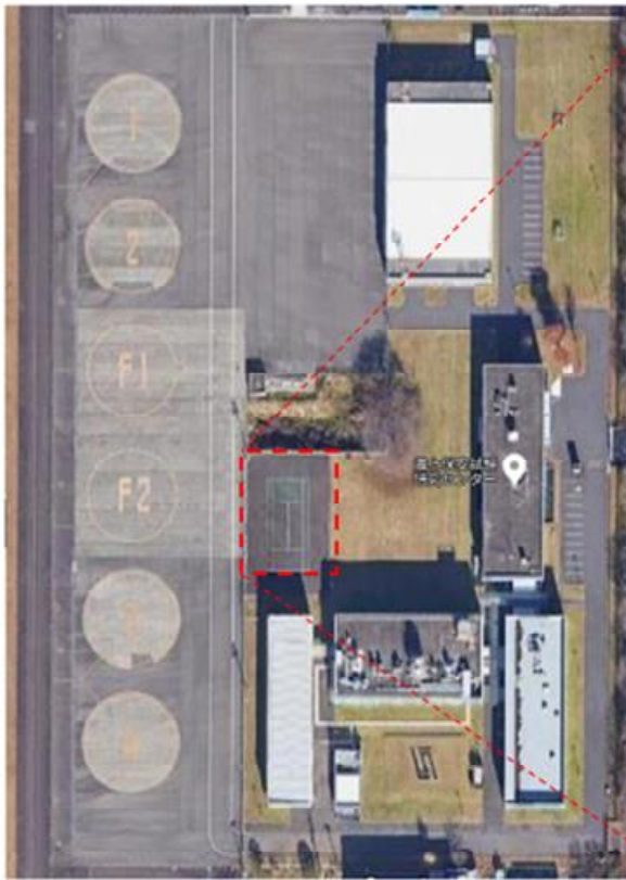
海上保安試験研究センター