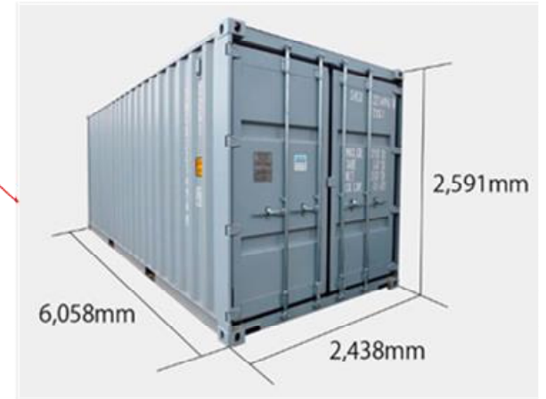
ISO規格 20フィートコンテナ