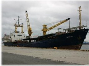
船員による持ち込み（小口密輸）