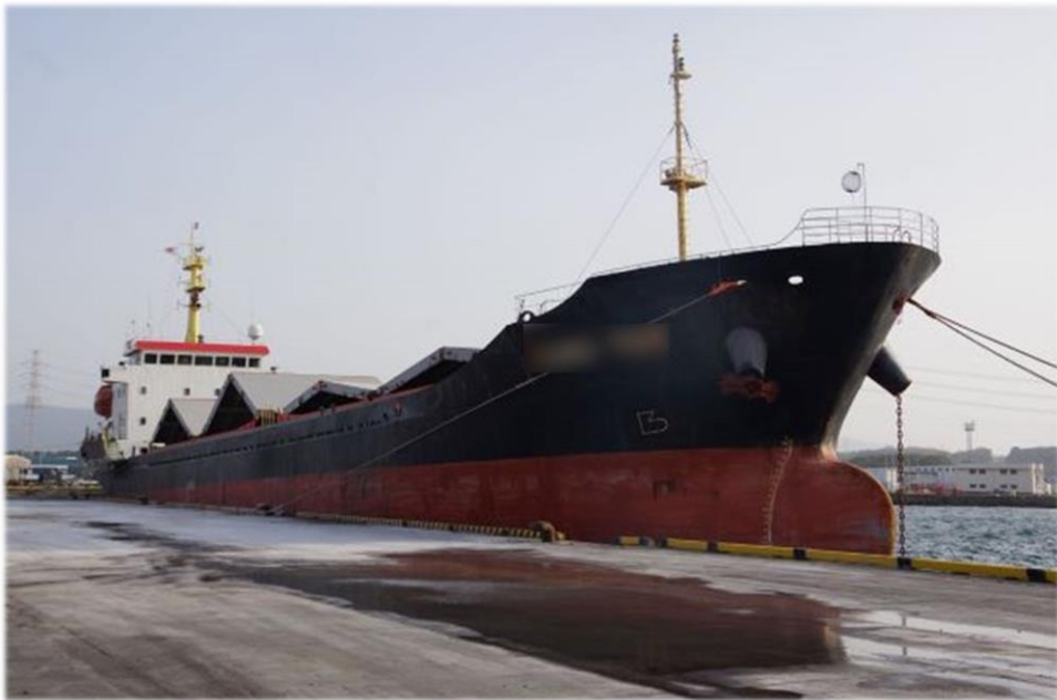
不正上陸したベトナム人船員が乗船していた貨物船

令和7年6月30日、大分海上保安部は、大分市大分港に入港したパナマ共和国籍貨物船から不正上陸したベトナム人船員1名を出入国管理及び難民認定法違反の疑いで逮捕しました。