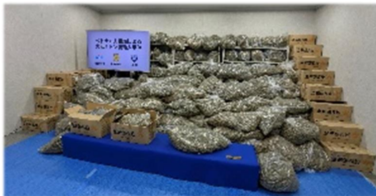
押収された大量の大麻（押収量約1トン）

第三管区海上保安本部は、関係機関と合同で、海上コンテナを用いて大麻約1トン（末端価格52億円相当）を本邦に輸入したとして、令和7年7月16日までに、麻薬及び向精神薬取締法違反（営利目的輸入、営利目的所持）の疑いで、ベトナム人3名を逮捕しました。