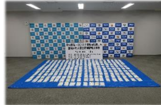
日本人（暴力団等）を主体とした犯行