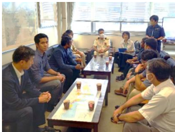
大分海上保安部表敬訪問