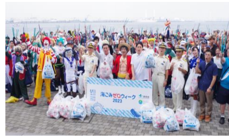
海ごみゼロウィークキックオフイベント

※ 環境省及び公益財団法人日本財団が、平成31年2月から推進している共同事業の1つであり、5月30日（ごみゼロの日）から6月5日（環境の日）を経て6月8日（世界海洋デー）前後までの期間を「海ごみゼロウィーク」として定め、同期間中に海洋ごみ削減に向けた全国一斉清掃活動を行い、その取組結果を世界へ発信する取組です。