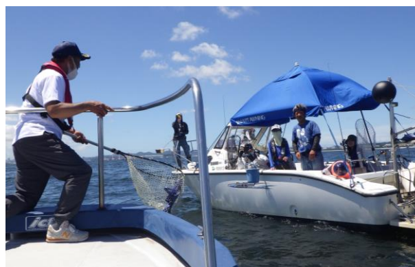
令和3年の合同パトロールの様子