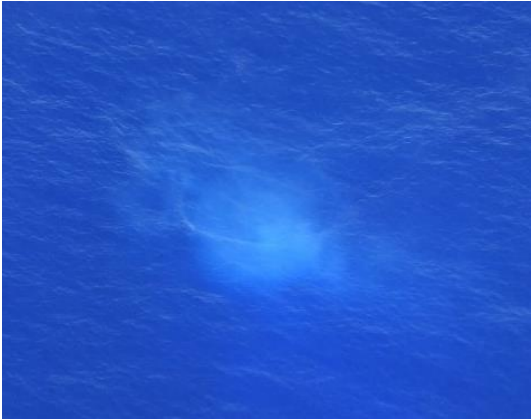
図1 海徳海山の変色水の様子(2022年8月23日 13:56 撮影)