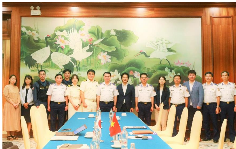
ベトナム海上警察幹部表敬