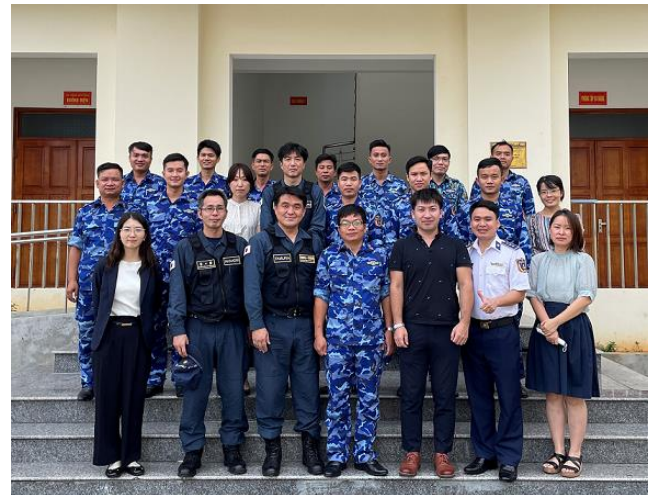
講義・実習参加者