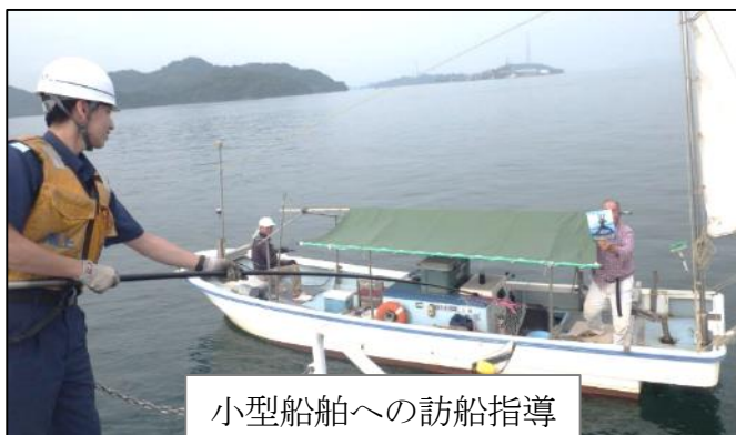
小型船舶への訪船指導