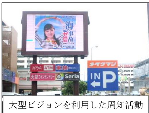
大型ビジョンを利用した周知活動