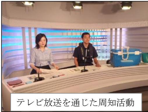
テレビ放送を通じた周知活動