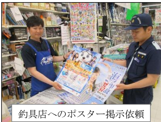
釣具店へのポスター掲示依頼