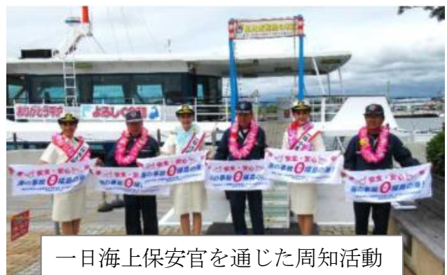
一日海上保安官を通じた周知活動