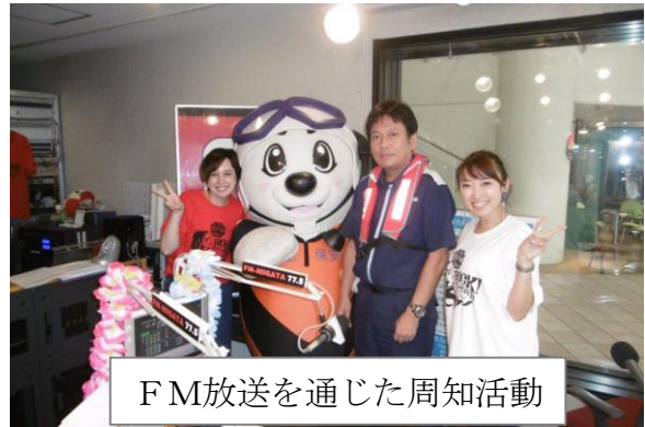
F M放送を通じた周知活動