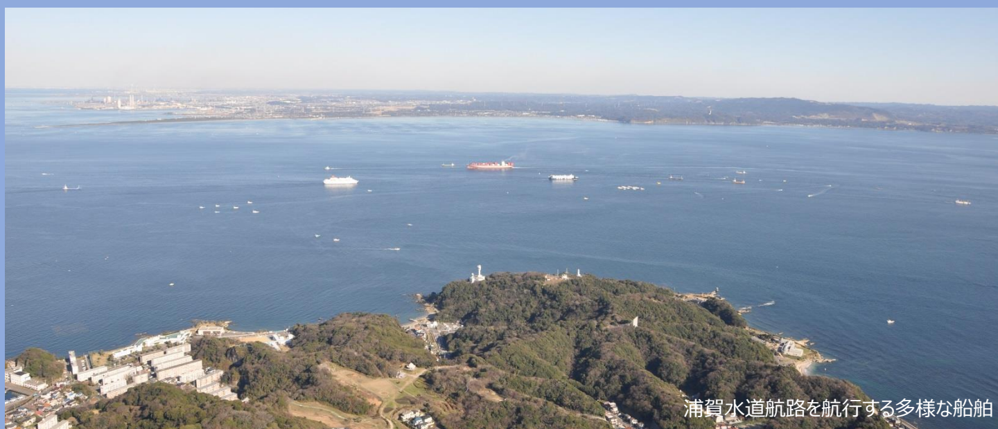
浦賀水道航路を航行する多様な船舶