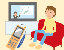
気象・水路情報の確認