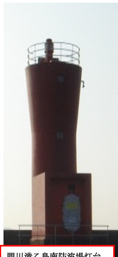
門川港乙島南防波堤灯台