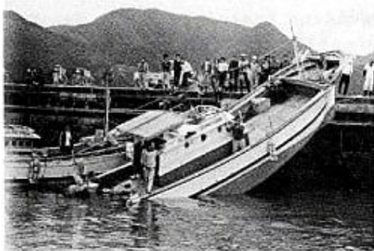
1979年3月31日の長崎県福江島富江港での船舶乗揚げ被害（西部海難防止協会「津波（長崎港アビキ）対策調査委員会報告書」（昭和57年3月より）

観測史上最大の「あびき」は、1979年（昭和54年）3月31日に長崎検潮所（長崎県）で観測されたもので、最大全振幅（海面昇降の谷から山までの高さ）が278センチに達しました。