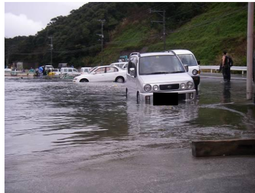
2009年2月25日の鹿児島県上甕島での道路冠水