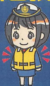
ライフジャケットの常時着用