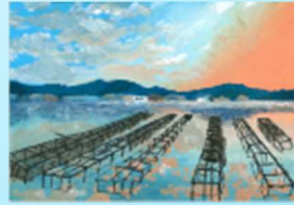
特別賞(国土交通大臣賞) 堀池 袖羽さん(当時小4 広島県広島市)