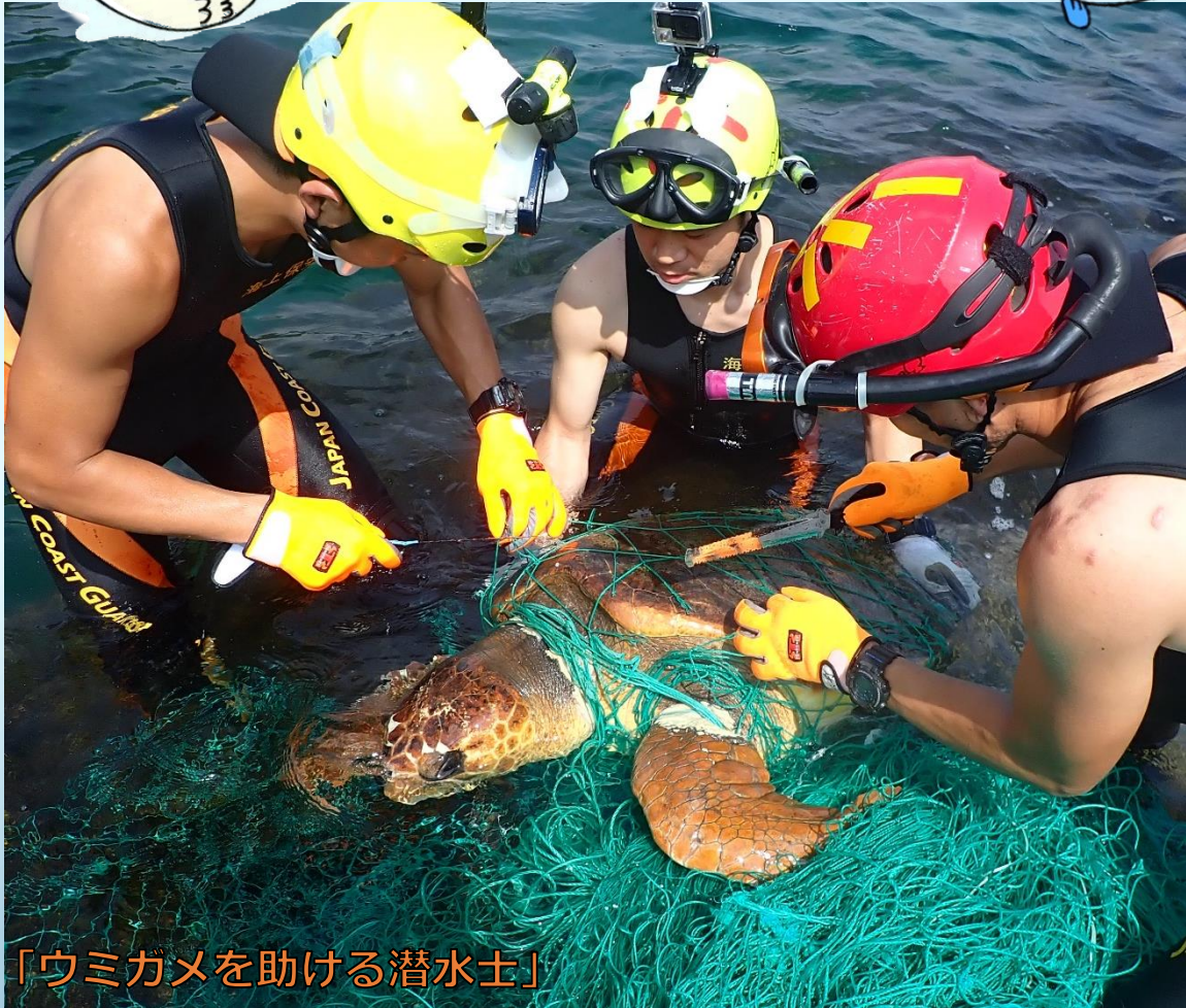
「ウミガメを助ける潜水士」