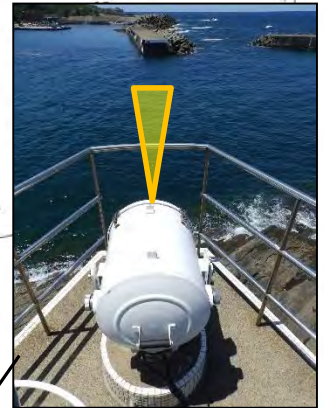
鷹巣港西方照射灯