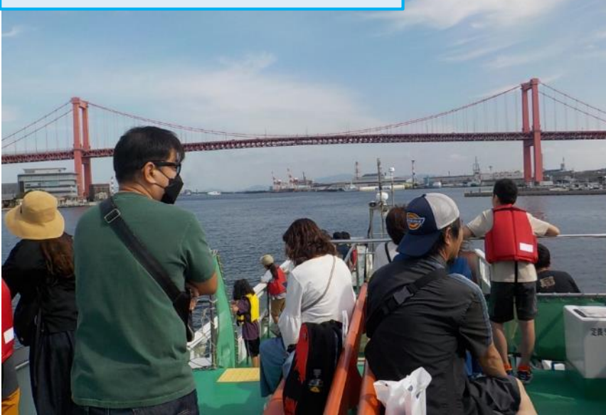
洞海湾内の説明を受ける参加者