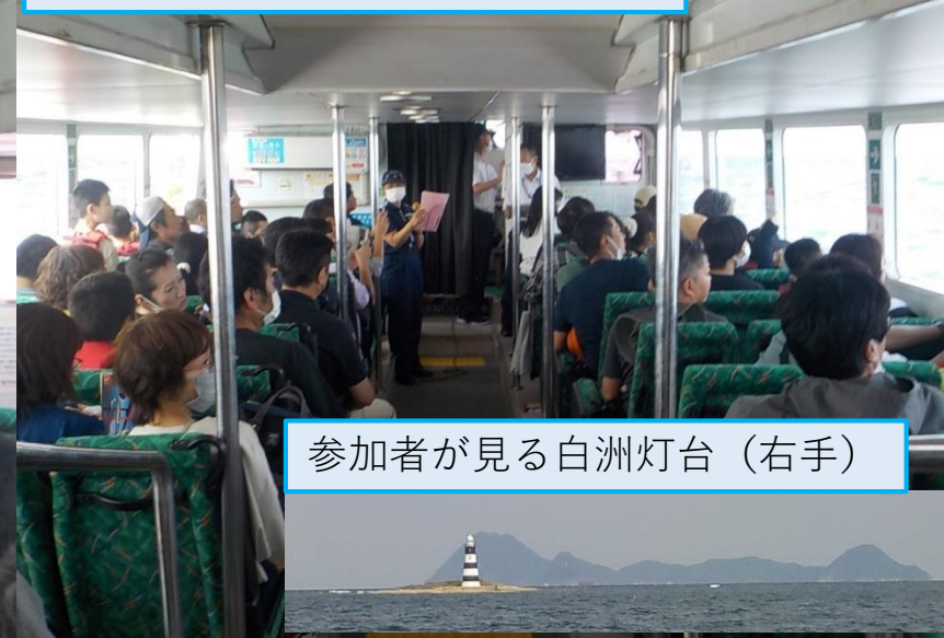
参加者が見る白洲灯台（右手）