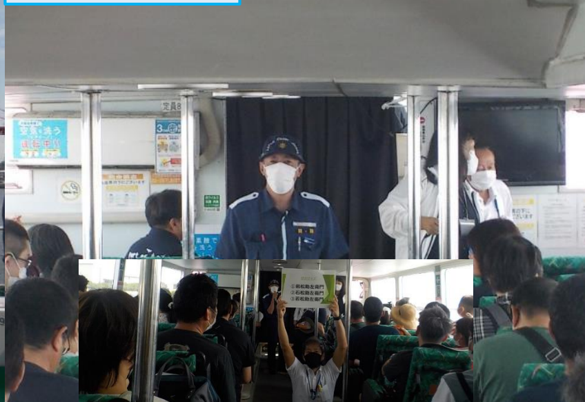
クイズを出す職員