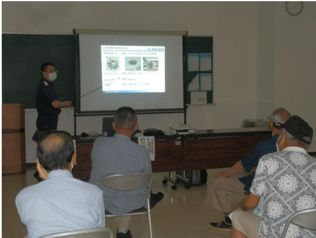
講習会資料(抜粋) 若松海上保安部管内における海難の現状