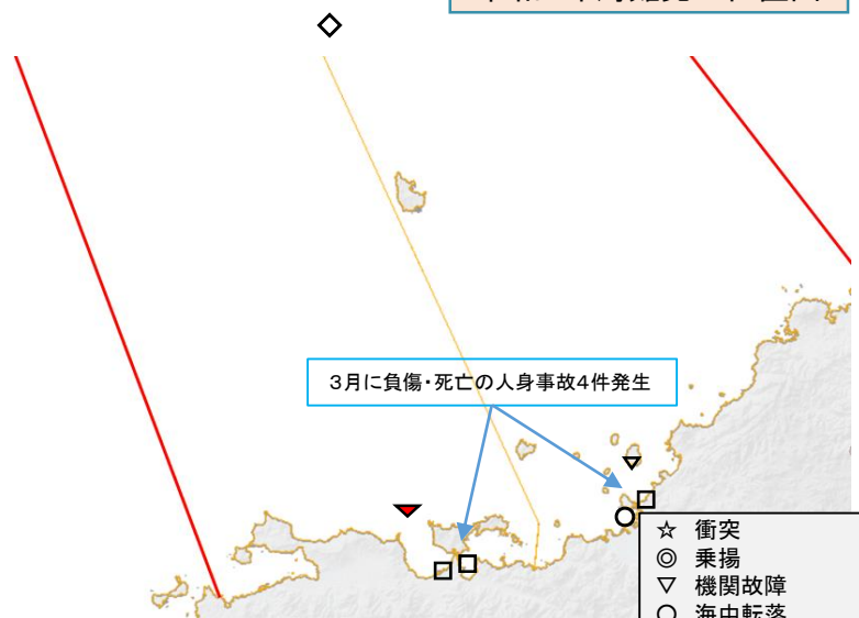
令和6年海難発生位置図