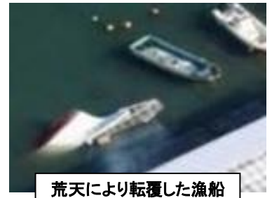
荒天により転覆した漁船