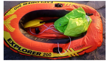
ゴムボートのイメージ ※本文と画像は無関係です。

陸岸から約300メートル沖合で漂流ゴムボート（オレンジ色、内部には釣具等が搭載されているが人の姿は認められず。）が発見され、連絡を受けた海上保安部では、乗船者が海中転落している可能性があるため、直ちに捜索を開始。巡視艇や航空機の勢力を投入して捜索を行っていました。ところが、数日後、海上保安庁の「 海の安全情報 」で漂流ゴムボートの情報を知った所有者から連絡がありました。波打ち際にてゴムボートを準備中、忘れ物を取りに帰り、戻るとゴムボートが見当たらず近くを探すも発見できなかったもので、どこにも届出や連絡等は行っていないとのことでした。結果、波風で流失したものと推定され、事件事故によるものではないことが確認されました。