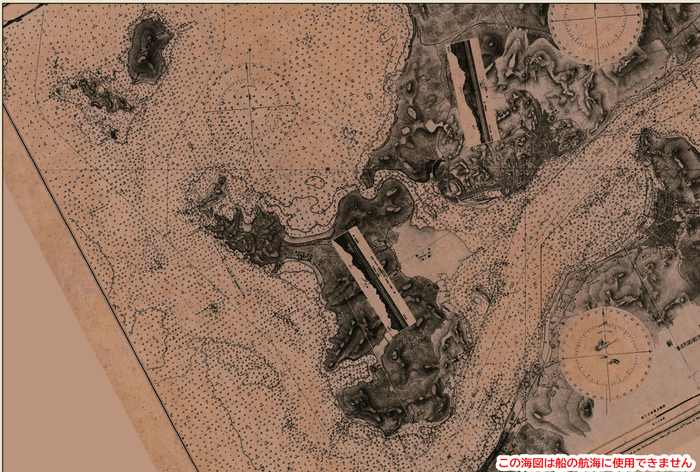
明治38年（1905年）頃の下関港付近（明治33年水路部刊行第百三十五号「下関海峡」）