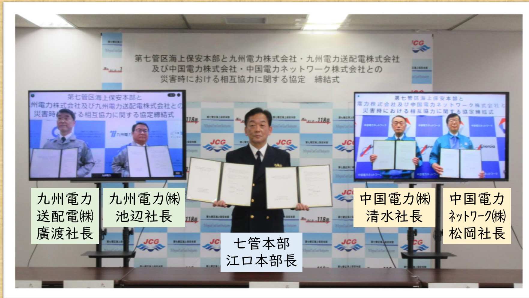
九州電力 送配電(株) 廣渡社長