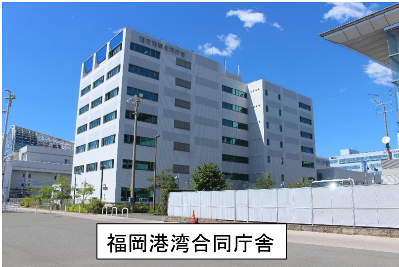
福岡港湾合同庁舎

※福岡港湾合同庁舎の外来駐車場は利用できませんので、 近隣の有料駐車場又は公共交通機関をご利用ください。