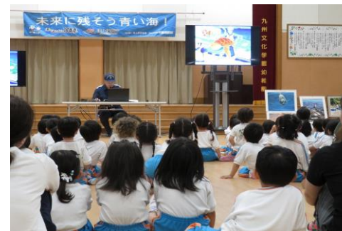
海洋環境保全教室