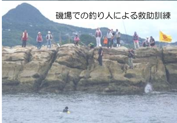
磯場での釣り人による救助訓練

今回の訓練は、磯場で釣り人が海中転落したことを想定し、想定転落者が実際に海中に入り、周りの釣り人が身の回りの物を実際に使用して救助することと、漕いでいたカヌーが転覆したことを想定し、実際にカヌーを使用し、カヌーを起し溺水者の救助をするというものです。