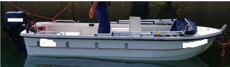
波を船側から受け海水が船内に入り転覆したプレジャーボート