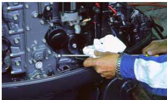
オイル量計測状況

オイルは、油量減少の場合は補給、乳化等の場合（水分混入箇所の確認）や規定時間（期間）運転したら交換しましょう。