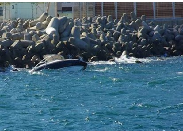
波が船内に入り機関が停止し、漂着したプレジャーボート

7月から9月にかけて、プレジャーボートやミニボートなどが波を受けて転覆し、乗っていた人が海中転落したり、波による海水の流入により機関が停止して、漂流するなどの事案が多く発生しました。9月に発生した事案は、プレジャーボートに3名が乗船し釣りをしていたところ、風が強くなってきたことから港に帰ることとし、強い風の中を航行している途中で船尾方向から波を受け、船内に海水が流入し転覆したものです。乗船していた3名は海中に投げ出されましたが、間もなく付近を航行していた船に救助されました。3名がライフジャケットを着用していたことも無事に救助された要因でした。また、水上オートバイを運転中に横波を受け海上に投げ出されてしまう事案や、ミニボートや手漕ぎボートで釣りに出ているときに波を受けて転覆した事案、海水が船内に入り機関が停止し復旧できずそのまま漂流して、テトラポット付近に漂着した事案がありました。小さい船にとっては、風浪やうねり、航走波といった波による影響は自船の航行に大きな影響を及ぼしますので注意が必要です。また、海上の様子は、天候により大きく左右されます。天気予報でにわか雨が予想される日などは、雨の直前に急に風が強くなるなど、海の様子が一変することも多々あります。風が強くなくても降雨により視界が急激に悪くなり、自分の船の位置がどこかわからなくなりパニックになることもあります。まだまだ天気が安定しない日が続いていますが、マリンレジャーに出かける際には天気予報の細めなチェックをお願いします。また、自分の命を自分で守るため、また同行者の命を守るために、ライフジャケットの着用の励行をよろしくをお願いします。