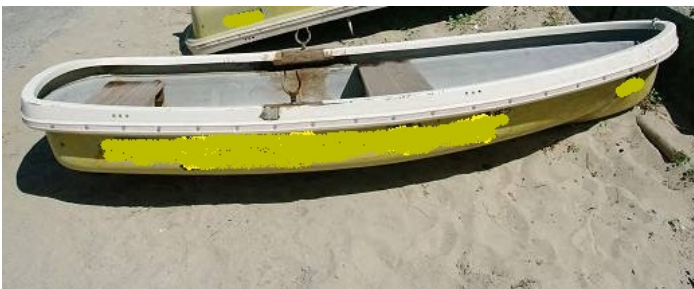
波を船側から受け転覆した手漕ぎボート