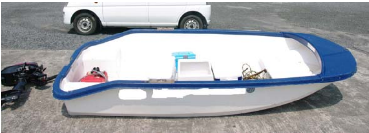
波を船首から受け海水が船内に入り転覆したプレジャーボート