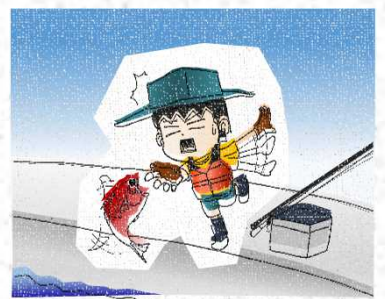
海に近づきすぎないように

また、夜間の海中転落は発見されにくいことを知り、夜間に海のそばへ行く時は周到な準備と自己の責任のもとで行動しましょう。