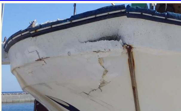
船首部を損傷したプレジャーボート

1月は衝突事故が2日間に集中して 6件 (12隻) 発生しました。 船種別では漁船が6隻と最も多く、次いでプレジャーボート3隻の順 となっています。