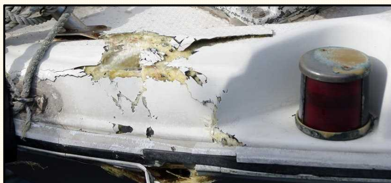
船首部を損傷したプレジャーボート

衝突の原因は、 作業への没頭 によるものか、 相手船が避けてくれる だろう といった 憶測 です。