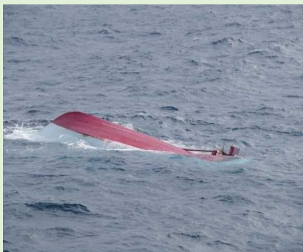
衝突、浸水しその後転覆したA丸

甲板上で作業をしていた船長が、釣り客の叫び声を聞きその方向を確認すると、自船に向かって一直線に航行してくる漁船を発見、直ちに船橋へ戻り機関を操作しようとしたのですが、時すでに遅く、衝突、その後浸水し転覆してしまいました。乗員、乗客は怪我人が出たものの全員救助されました。船体は近くの港へ曳航されました。