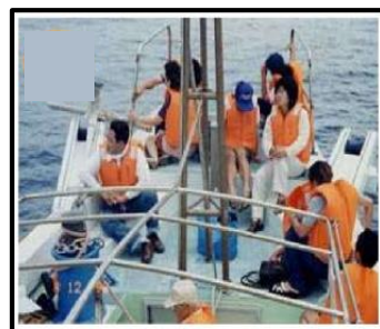
暴露甲板に乗船している者

上記、着用義務に違反した船長は、 令和4年2月1日 から違反点数2点(他人を死傷させた場合は5点)が付与されます。