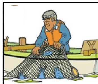
単独乗船の漁船で漁労作業をする者