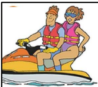
水上オートバイに乗船する者