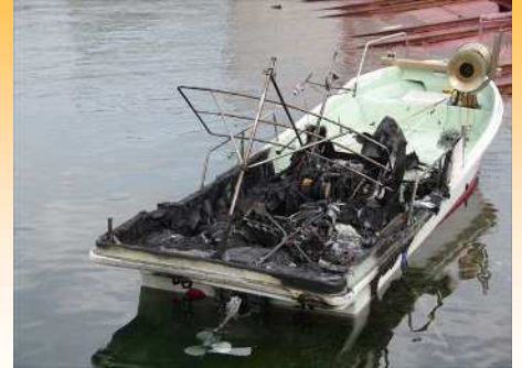
【バッテリー充電中発火したB丸】