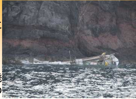
【帰港中に岩場に乗揚げたA丸】