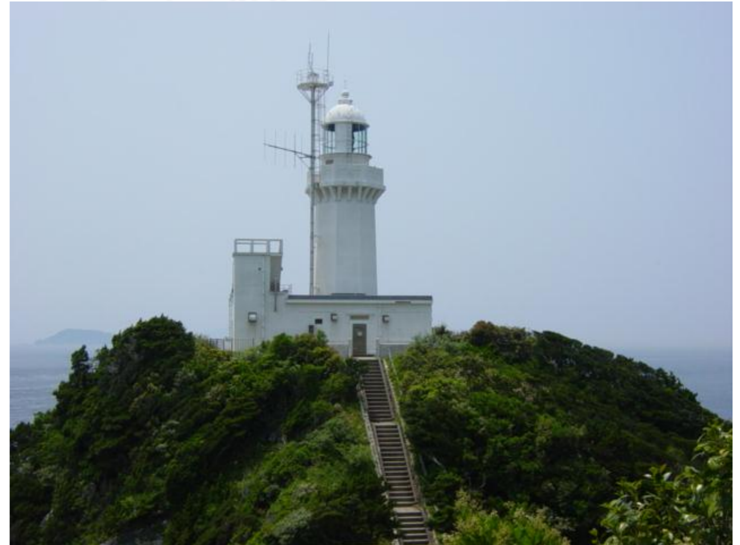
【佐田岬灯台（愛媛県西宇和郡伊方町）】