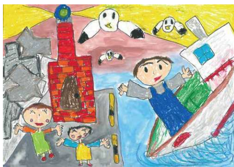
2020 小学生低学年金賞