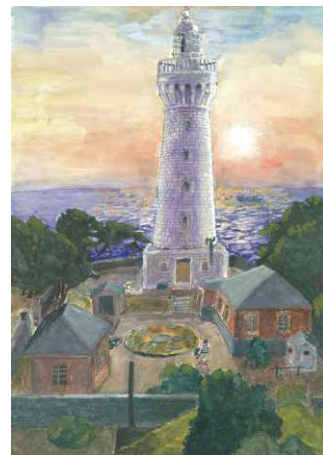
2020 小学生高学年金賞