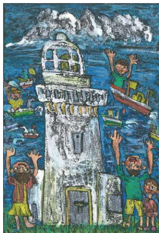
2020 海上保安庁長官賞