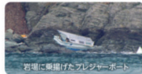
岩場に乗揚げたプレジャーボート

機関を停止し釣りをしていた2名乗りのプレジャーボート。移動しようとするも 機関が起動せず航行不能となり、風浪に流され付近岩場に乗揚げた 。乗船者は当庁航空機により救助され、命に別状はなかったが、発見遅れば重大事故に。