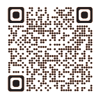
Water Safety Guide SUP編

転覆・落水時に元の体制に戻れず、漂流する海難が発生しています。落水時の対処方法等しっかり技能を身につけて遊びましょう！