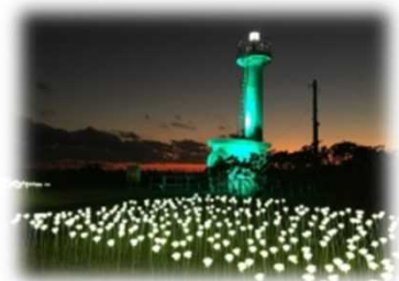
灯台及びその周辺のライトアップ