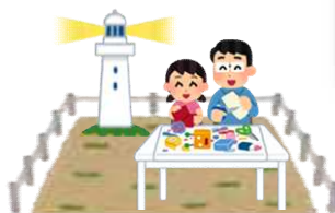
灯台敷地内でのワークショップの開催