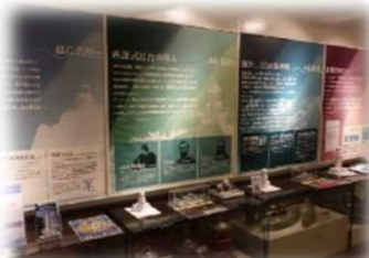
灯台の歴史等に関する資料館