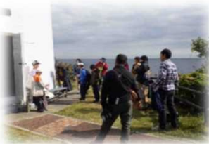
灯台の歴史に関する情報の収集活動