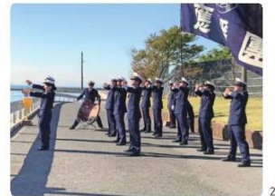
1) お気に入りの三ツ石寮の屋上から見た夕日。 2) 応援団長として活躍するIさん。