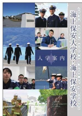
海上保安大学校・海上保安学校 パンフレット