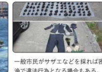
一般市民がサザエなどを採れば密漁で違法行為となる場合もある。