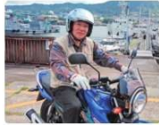
休日は愛車でツーリングをするのが楽しみ。神山峠や御手洗などに出かけることが多い。

灯台・ブイなどの航路標識の点検業務に40年以上従事している大ベテランのHさんは、様々な経験を活かし業務に取り組むと共に後輩へ技能の伝承も担う。海が大好きでそこで見かけた工事の現場監督に憧れ海上保安部の仕事に就いた。定年後もヘルメットを被り点検や工事の監督など、子どもの頃の夢“ゲンバの仕事”一筋で続けている。「最近はやっとと厳しいとバフハラで訴えられますが、定年まで頑張れたのは若い頃厳しい指導を受けたことで得た忍耐強さのおかげだと思います」とHさん。呉を一望できる海上保安部の屋上からの眺めがお気に入りスポット。