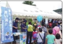
市民への環境保全の啓発のほか、廃船などの不法投棄の調査・検挙を実施。