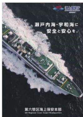
第六管区海上保安本部パンフレット

業務紹介・採用などの詳しい情報を掲載した資料もご用意しています。 上記の連絡先へお問い合わせください。