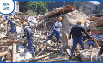
西日本豪雨災害でのボランティア活動の様子。