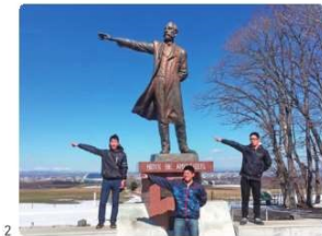
1) 2020年7月に行われた遠泳訓練後の集合写真。 2) 旅行が趣味で47都道府県を制覇したそう。