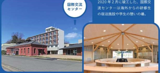
2020年2月に竣工した、国際交流センターは海外からの研修生の宿泊施設や学生の憩いの場。