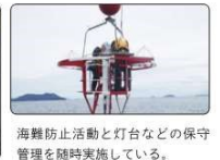
海難防止活動と灯台などの保守管理を随時実施している。