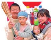
プライベートでは2児の父。休日は公園に出かけたり、ショッピングモールで買い物など、家族と過ごすことが多い。

海上での警備救難や船のメンテナンスなどを担う「巡視艇おとかせ」機関長のNさん。エンジンを動かす機関科の業務の他、船長とともに危険な作業を安全に行えるよう若手の訓練指導やコミュニケーションを図り様々な世代の乗員をまとめる役割も務めるベテラン。実際の現場で日々培ってきたチームワークを活かし、事件事故を解決できると達成感を感じるそうだ。「厳しい訓練や大変な災害支援などありますが救助した方からお礼の手紙や言葉をもらえると、この仕事をして良かったと思います」。公園やショッピングモールなどへ出かけて家族で過ごすのが休日の楽しみ。