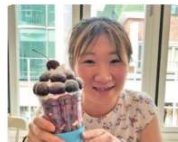
旅行が趣味の T さん。韓国へ旅行に行った時にカフェで撮影した一枚。

地元が海から近く海上保安庁は身近な存在で、「船に乗ってみたい」という思いから海上保安学校に入校。現在は巡視船くろせの通信科で無線連絡、通信機器の管理などの業務を務める。出港時は危険なことも多く毎回初めての経験の中、落ち着いて安全確保を心がけている。「全国各地、様々な業務で活躍する保安学校の同期は大切な存在です。同期が頑張っている話を聞くと、自分も頑張ろうと励みになります」と T さん。今後は海上保安大学校の語学研修で 1 年間学んだ韓国語を活かせる配置に就きたいそうだ。休日は、海の景色を楽しみながらドライブするのが定番。