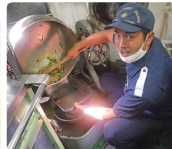
1) 大釜で食事を作るTさん。 2) 休日はお子さんと自転車や車の練習を一緒にするなど家族と過ごすことが多い。