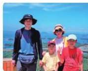
長男と次男の父親。陸上勤務、結婚生活、子育ては呉市からスタートした。「くれれば」などの育児イベントに参加したことが大切な思い出。九州旅行での家族写真。

広報対応や予算・物品の管理などを行う管理課で渉外係長をしている入庁 22 年目の S さん。2020 年 3 月までは六管本部の船舶技術部で船の維持管理や修繕を担当する船舶工務官などとして勤務。新しい巡視船を建造する監督業務も行っていたため、船舶や機器に対する関心が高いそうだ。「呉市は船に関連した企業や技術が集まっており、造船関係やマリナーに従事する皆様には六管の船だけでなく、全国の巡視船が大変お世話になっています」と将来的にまた修繕や建造に関わりたいたと話す。広報としては、様々な職種がある海上保安庁の仕事について積極的に PR したいそうだ。