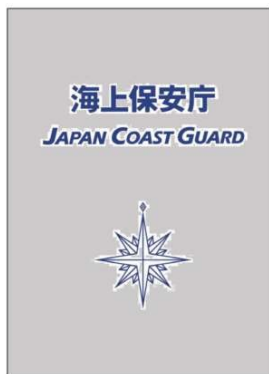
海上保安庁パンフレット