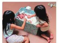
2020年9月に誕生した長男と長女、次女。上司の勧めで育児休暇を取得し、家族のサポートをしており、ライフワークバランスも充実している。

機械いじりが好きで高等専門学校へ進学。フェリーの機関士を経て、26歳の時、長女が誕生したことで「格好いい父親、を見せたいと資格を活かして海上保安官を目指し、門司分校から入庁したいというKさん。その後、幹部候補生を養成する部内研修の海上保安大学校特修科へ進み、現在は「巡視船くろせ」で機関科の士官として海上の治安維持、海難救助、運航や整備などを担当している。海難救助の要請があった際、陸上からの情報を元に人員を割り振り、潜水士に的確な指示することを心掛けている。「一分一秒を争う現場ですから潜水士と陸上とのコミュニケーションが重要。そのために普段からチームワークの強化を意識しています」とKさん。