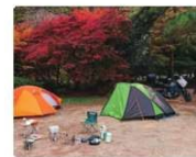
廿日市に上司とキャンプへ行った時の写真。休日は、バイクでツーリングすることが多いのだとか。