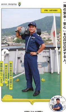
「海の安全・安心」をDESIGNする。

呉海上保安部 巡視船くるせ着任。2020年7月号にて、くれえばんデビュー。潜水士を目指す。