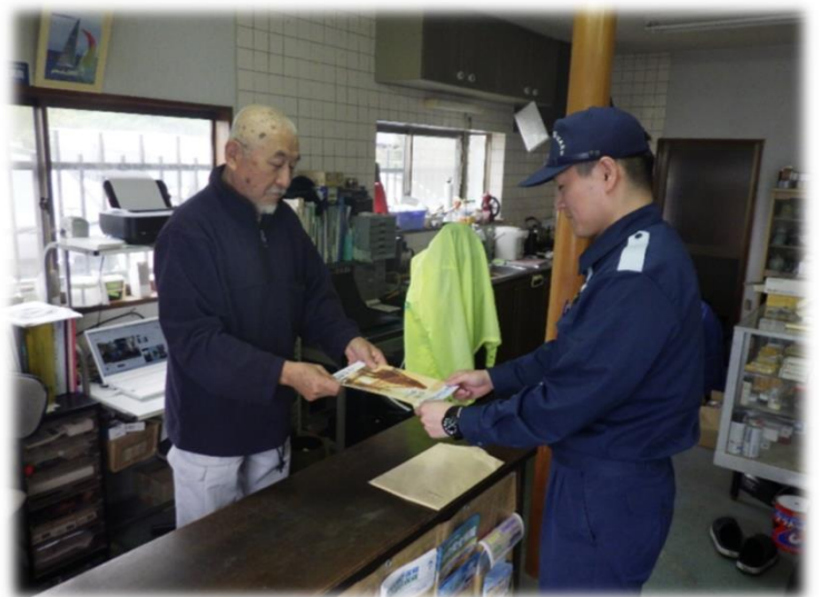
【マリーナでの訪問指導の状況】