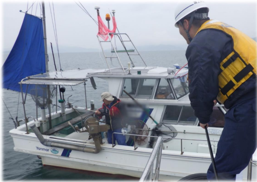
【海上安全指導員との合同パトロール】