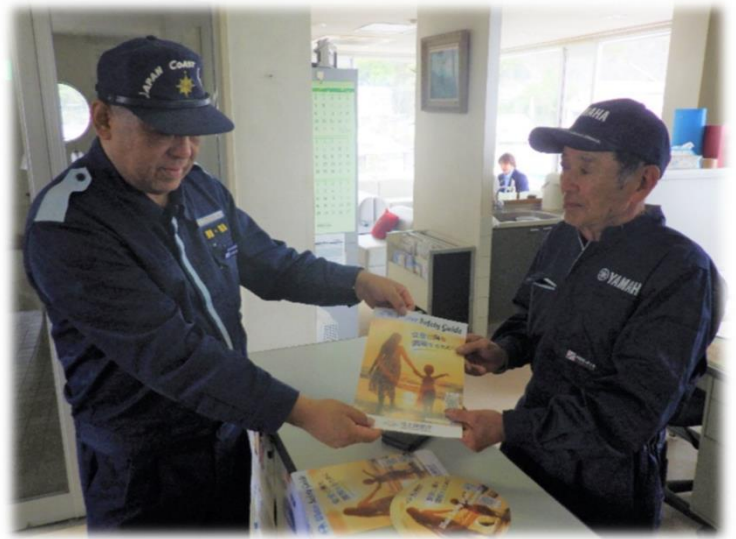
【事前周知活動の状況】