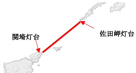
③瀬戸内海西部海域（西側境界）