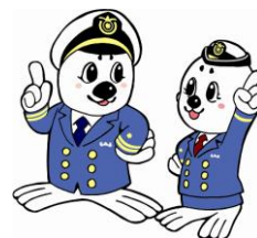
「うみまる」と「うーみん」