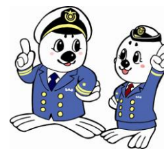
「うみまる」と「うーみん」