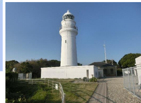
潮岬灯台(明治6年点灯)