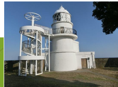
檜野埼灯台(明治3年点灯)