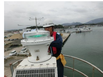
灯台の維持管理作業

航路標識とは、船舶が自らの位置を正しく知ったり、危険な場所を避けるなど、安全に航海するために必要な海の道しるべです。光を利用した灯台は、みなさまもご存知ではないでしょうか。他にも電波を利用したり、音を出したりするものがあります。田辺海上保安部では、現在72基の航路標識の維持管理を行っています。