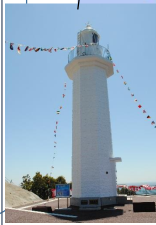
紀伊日ノ御埼灯台 (明治28年点灯)

潮岬灯台にライブカメラを設置し、現地のリアルタイム映像を24時間配信しています。(トップページをご覧ください。)