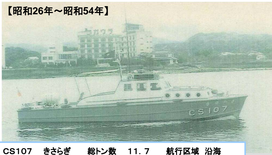
CS107 きさらぎ 総トン数 11.7 航行区域 沿海 主要寸法（全長×巾×深さ） 12.0×3.1×1.5