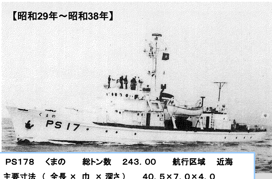
PS178 くまの 総トン数 243.00 航行区域 近海 主要寸法（全長×巾×深さ） 40.5×7.0×4.0