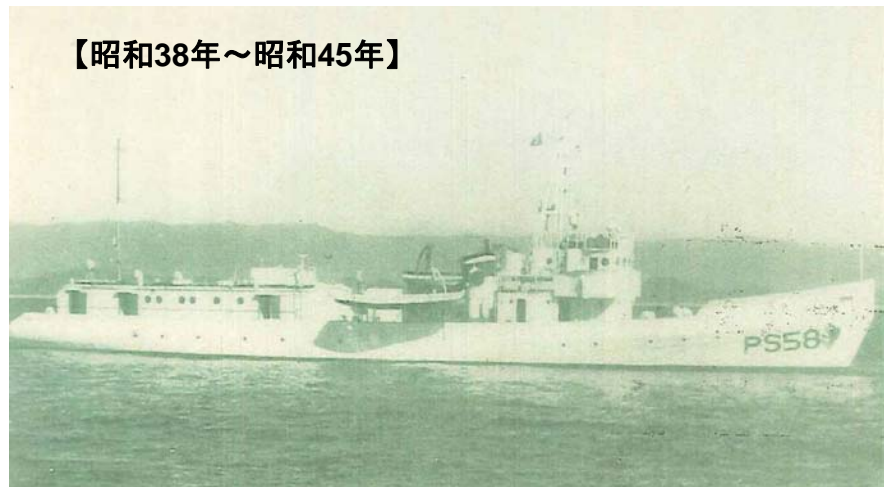
PS105(PS58) ともちどり 総トン数 227.00 航行区域 沿海 主要寸法（全長×巾×深さ） 46.5×6.8×3.5