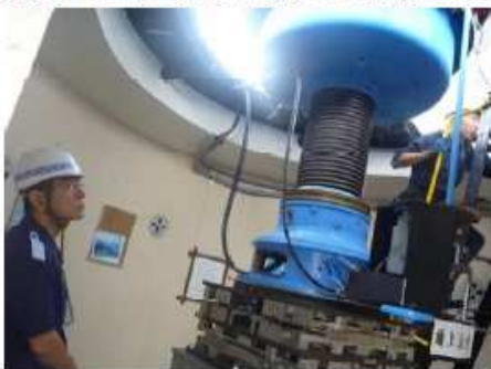
航路標識保守点検

航路標識を、無線回線や電話回線を利用した監視システムなどによって常に監視し、事故が発生した場合には、速やかに復旧を行い、船舶交通の安全確保、海難の未然防止に努めています。