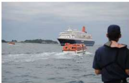
大型クルーズ客船の 安全確認

田辺港は、港則法により特定港に指定され、港内の船舶交通の安全確保及び港内の整とんを図っています。