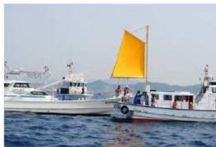
海上安全指導員との 合同パトロール

海上安全指導員等と連携協力し、プレジャーボートに対する安全推進活動を実施しています。