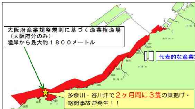
沿岸海域(赤色)内に設置されている漁業施設

大阪湾南部沿岸の海域には、漁礁・定置網・いけす等 多くの漁業施設が海上に設置 されています。 冬場には「のり網」も多数設置 され、発見が遅れたりすると、乗揚げたり網に絡んだりし、航行ができなくなることもあります。これらの施設は種類や漁期により設置位置が変わる場合もあり、喫水が深い船舶がこの海域を航行する場合は、 十分な注意が必要 です。